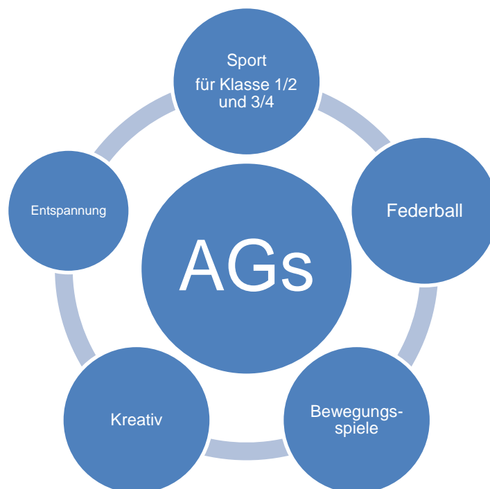
Abb. 3: Derzeitige Arbeitsgemeinschaften in der OGGS Lioba

Die Arbeitsgemeinschaften und Freizeitangebote finden täglich in der Zeit von 14.45 Uhr bis 15.30 Uhr statt. Die Inhalte der Angebote wechseln regelmäßig und orientieren sich an den Interessen der Kinder: